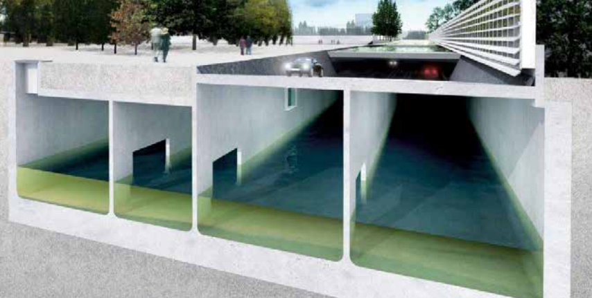
Museum car park med oversvømmelses reservoir.