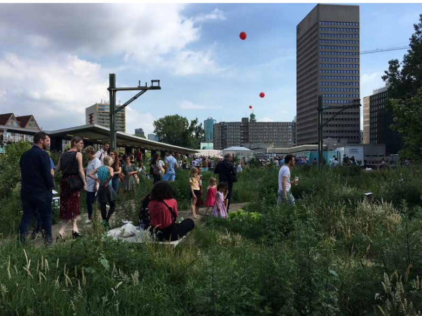
Grønt tag på tidligere S-togstation.

På turen videre passerer vi et grønt tag på en tidligere S-bane station. Gåturen varer ca. 15 minutter. Herudover ca. 15 minutters ophold.