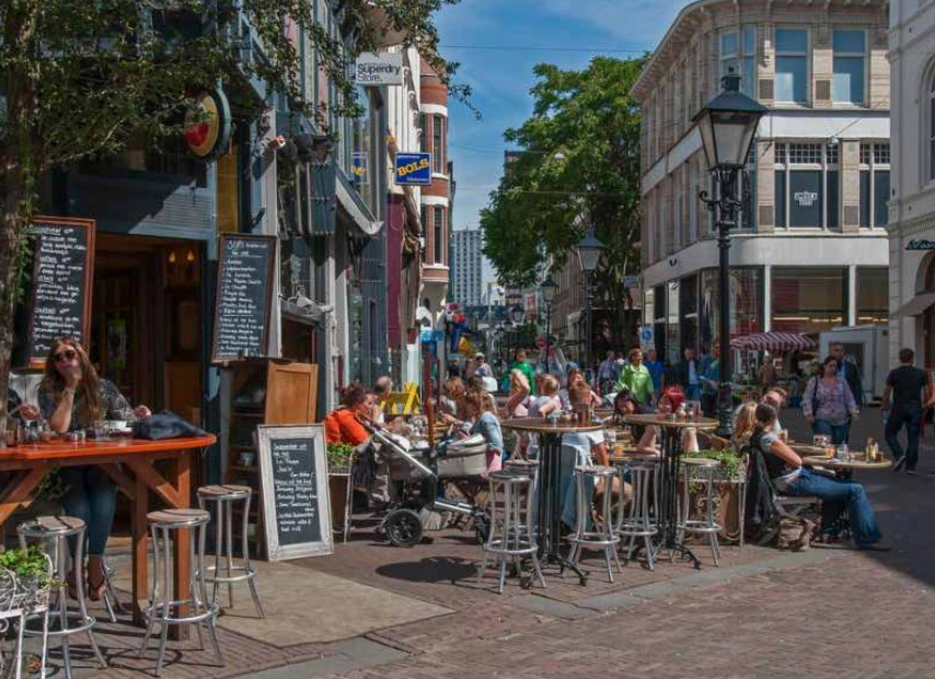
Witte de Withstraat, gamle Rotterdam.

Aftensmad. Restaurant Bazar, Witte de Withstraat 16, 3012 BP Rotterdam.