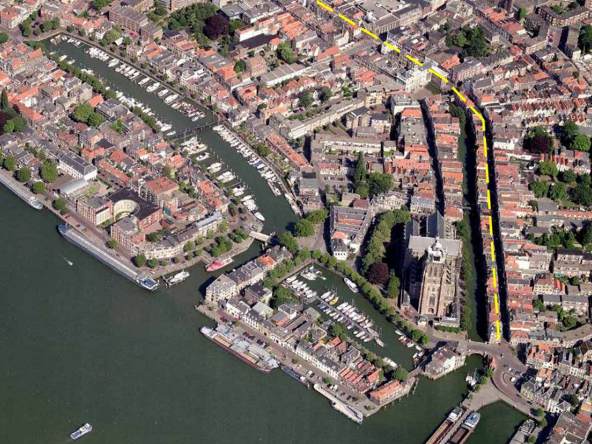
Den historiske bydel i Dordrecht.

Herefter kører vi i minibus til det moderne boligområde, Plan Tij.